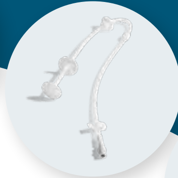
Argyle™* peritoneal dialysis catheters