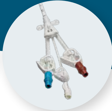
MAHURKAR™* Elite acute dialysis catheters