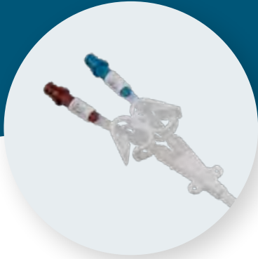
Palindrome™ Precision chronic dialysis catheters